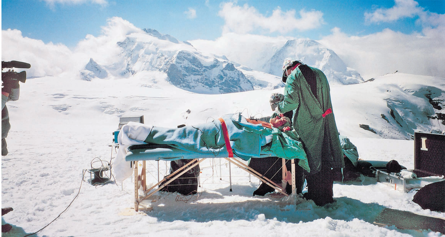
Keine Notoperation an einem verunglückten Bergsteiger, sondern ein Facelifting auf dem Längfluh-Gletscher. Der im Februar dieses Jahres verstorbene plastische Chirurg Urs Burki fürchtete gefährliche Keime in herkömmlichen Operationssälen und verlegte deshalb viele Operationen unter den freien Himmel.